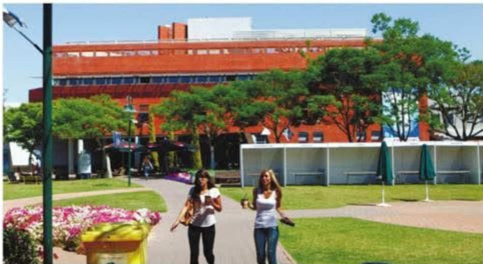
מפוס המכללה למינהל בראשל"צ. "האתגר הוא שסטודנט עם 630 בפסיכומטרי יתקבל לבעודה לצד בוגר הטכניון"

זהו סיבה מספיק טובה לשלם יותר 30-40 אלף שקל לשנת לימודים? אלה שאנחנו עושים עם הסטודנטים שלנו הוא הרבה יותר משמעותי. יש לנו בוגרים שהתקבלו לבעודה בחברות המובילות ולהתקדמים בכירים במשק. לקחת מישור עם 630 בספטימטר ולהתקבל לרמת מסלול שמאפשר לו להתחבר לחברת תוכנה כגד בוגרי טכניון - זה אומר הרבה יותר גדול, גם עבורנו וגם עבורו."