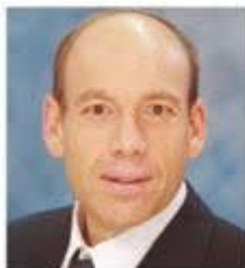
מנכ"ל תכניו אנגלמן

גורמת תשתית עיונית תאורטית מסימת, אבל השאלה היא מה המינון. צריך לחבר את הסטודנטים לפרקטיקה, ולא להשאיר אותם רק בעולמות התאוריה.